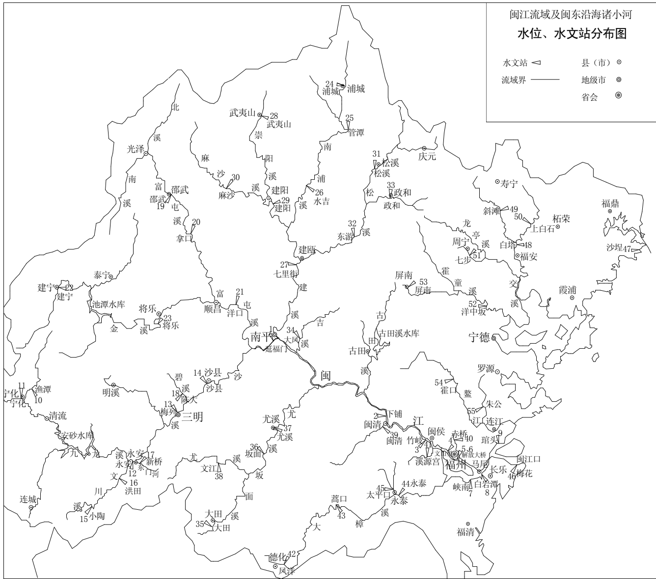
图 A-1 闽江流域及闽东沿海诸流域分布图