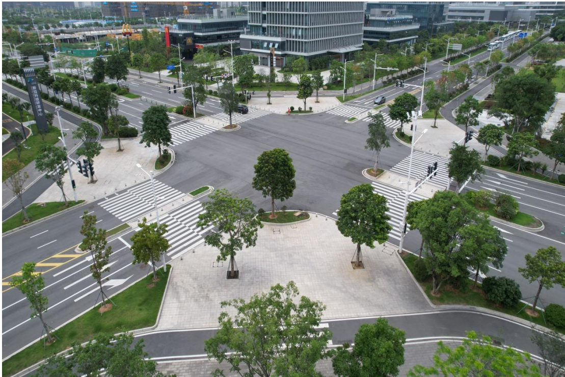
十字路口整体效果照片