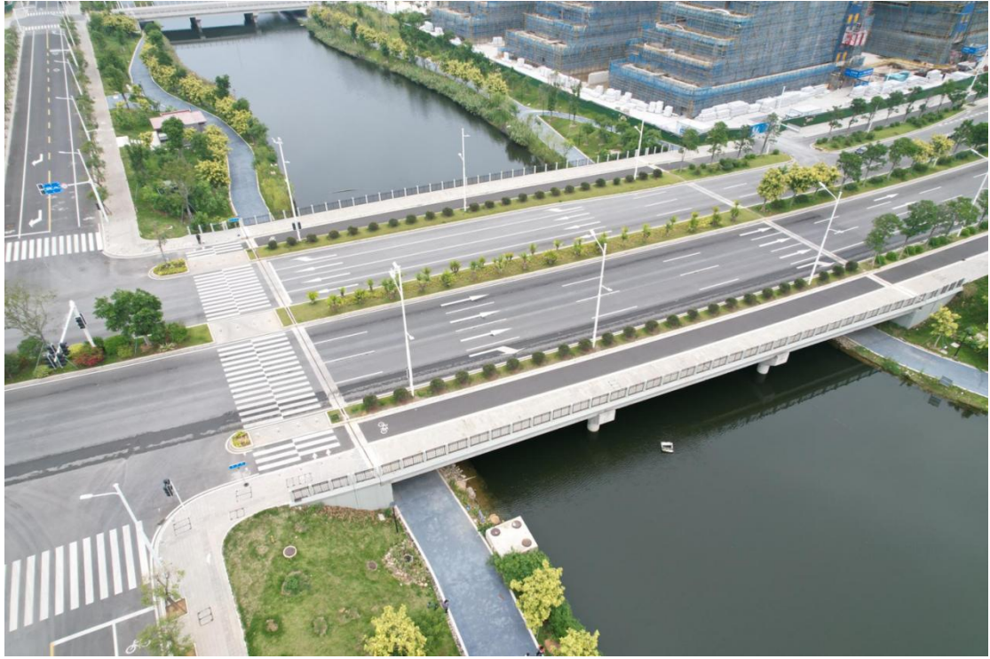
桩号 K1+636 桥梁全貌照片