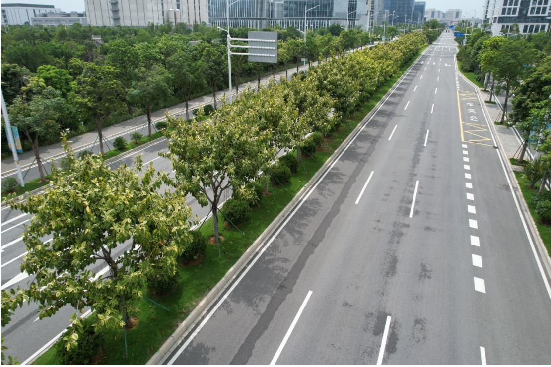
绿化工程全貌照片