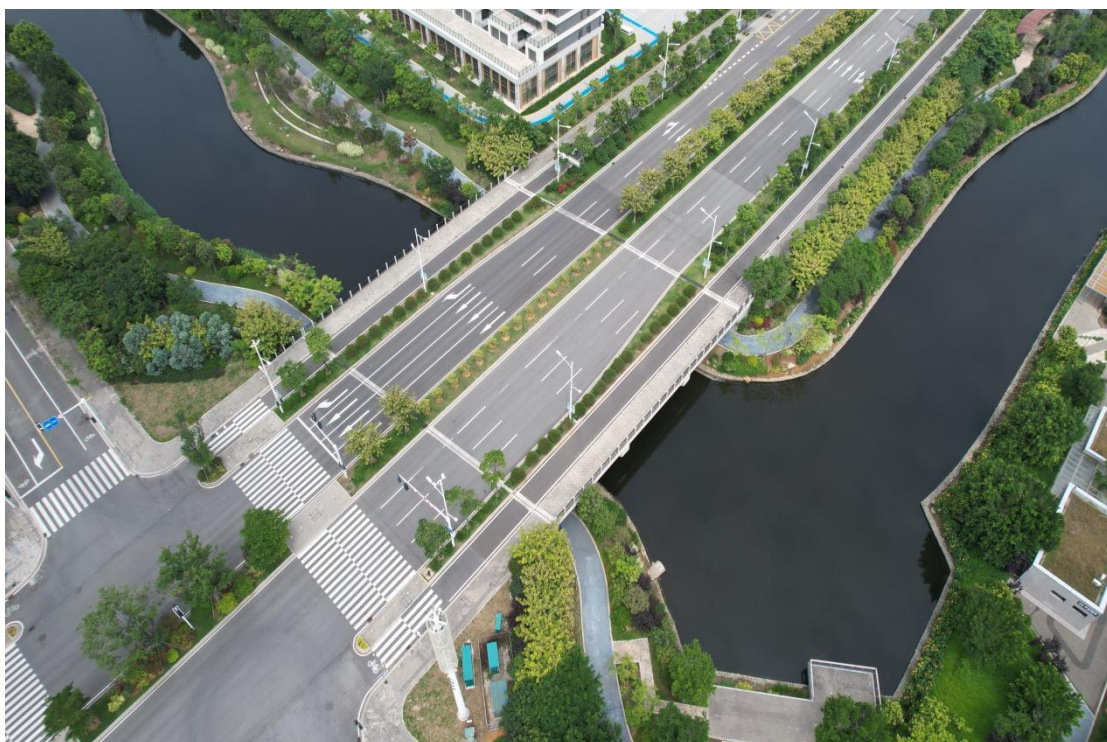
桩号 K0+507 桥梁全貌照片